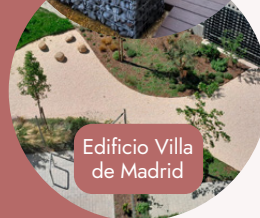
Edificio Villa de Madrid