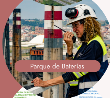
Parque de Baterías