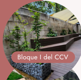
Bloque I del CCV