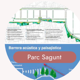
Barrera acústica y paisajística