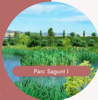
Parc Sagunt I

Reducción planificada en el consumo de agua del complejo en 2025. La disminución proyectada para los siguientes años es del 1%.