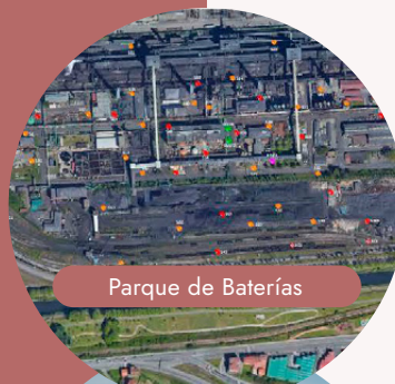
Parque de Baterías